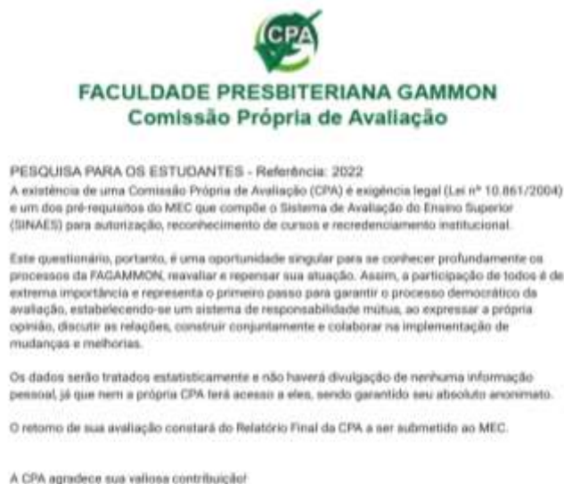
Figura 1 - Modelo de formulário eletrônico do Google docs aplicado aos estudantes (discentes de graduação).